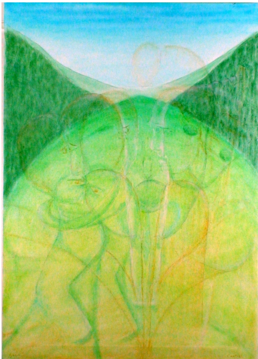
Opera 1 della serie “La leggerezza dell’essere”

Ispirato dal libro di “Norwegian wood” di Murakami Haruki